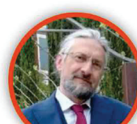
MASSIMO TAVOLA SECONDARIA DI PRIMO GRADO