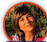
GIOVANNA MARIA BURRELLI SCUOLA PRIMARIA