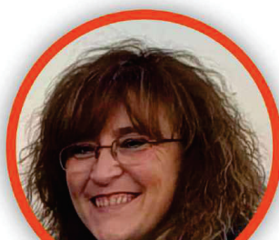
MARIANGELA MAPELLI SCUOLA PRIMARIA